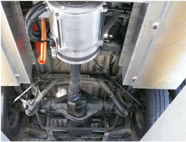
Elektromotor 150 kW / 201 PS