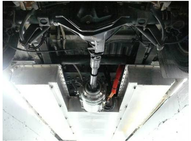
Batteriepaket 100 kWh