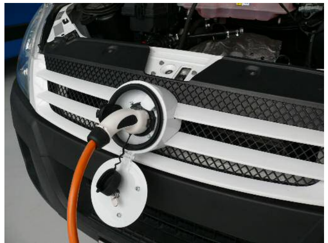
Ladestecker Typ 2