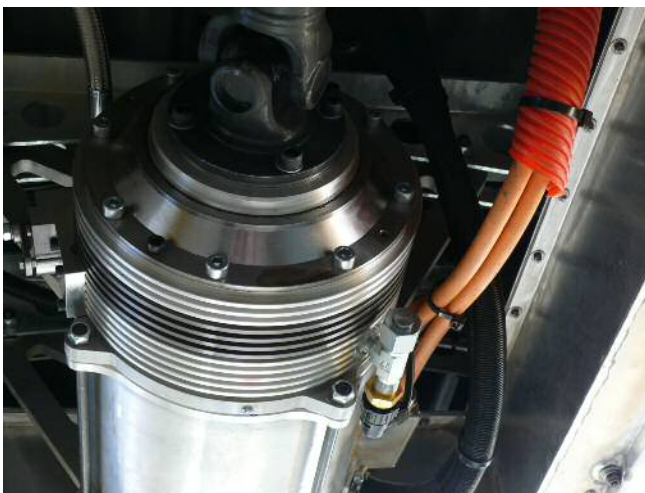
Planetengetriebe i = 4.5 Mit Parksperre