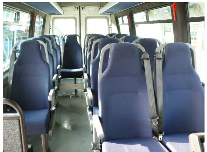
Stoffsitze mit Sicherheitsgurten und Armlehnen