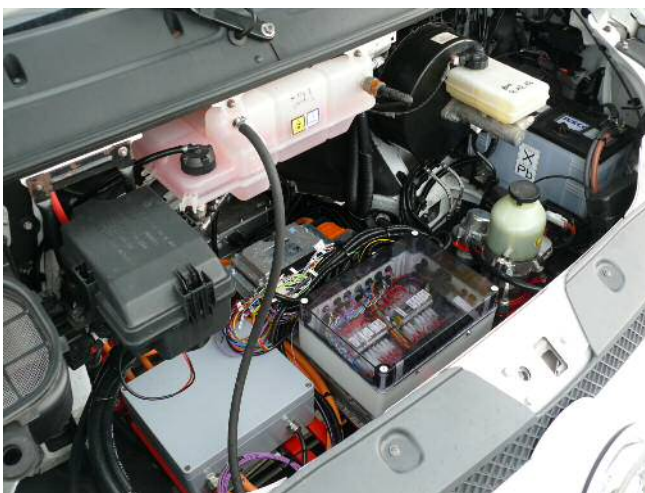
Elektronik mit Drehstromumrichter 450 V / 150 kW DC/AC Wandler, Bordnetzwan- dler 450 V auf 14 V 250 A, Schnelllade- gerät 22 kW AC/DC Wandler